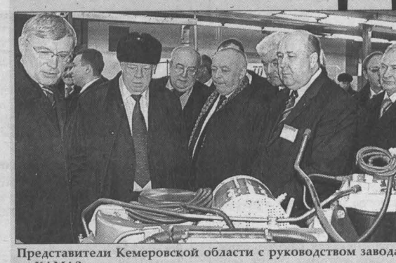
Представители Кемеровской области с руководством завода на КАМАЗе.

Как уже сообщал «Кузбасс», в Набережных Челнах, на КАМАЗе, побывала делегация администрации нашей области под руководством первого зама губернатора В.П.Мазикина. Сегодня мы публикуем репортаж об этой поездке.