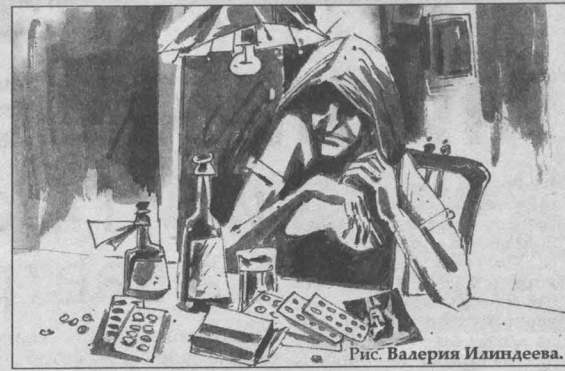
Рис. Валерия Илиндева.

Церковь, отказываясь в отпавании самоубийце, обращается прежде всего к живым: «Это не выход!» Один священник рассказывал, как однажды в воинской части, в которую он часто ходил, застрелился офицер. Сослуживцы не сомневались, что батюшка как положено похоронит их общего друга. Священник решительно отказал. «Да что же ты каноны и бумажки ставишь выше человека! Мы думали, ты человек, а ты... Мы и знать тебе теперь не знаем!» — много обидного тогда услышал в свой адрес священник. Двери той части теперь для батюшки были закрыты. Прошло полгода.