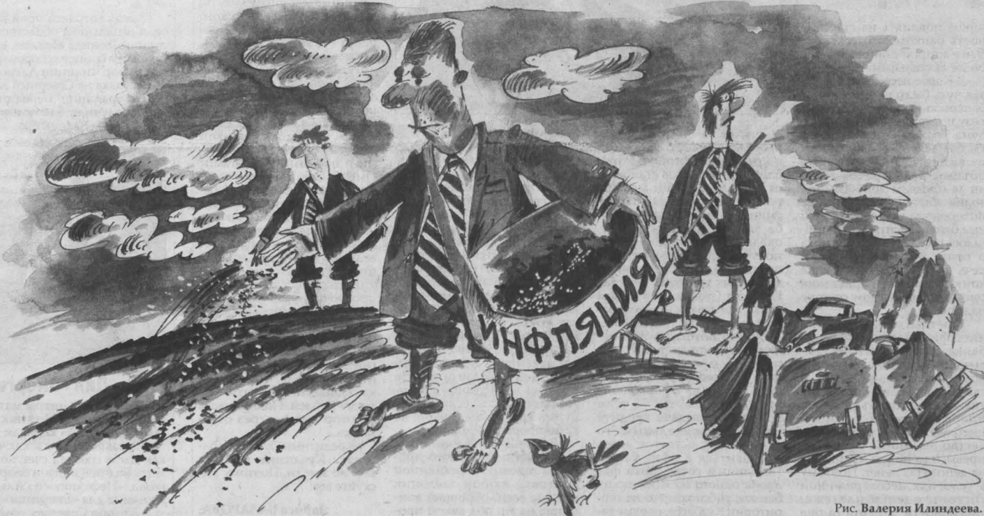
Рис. Валерия Илиндева.

Читатели могут связаться с автором этого материала и высказать свое мнение сегодня с 14 до 15 часов по телефону 52-23-29.