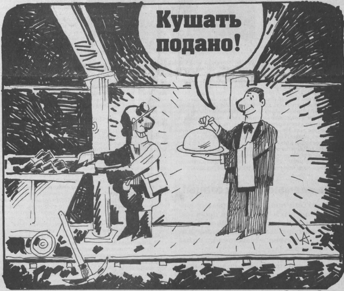
Рис. Андрея Горшкова.