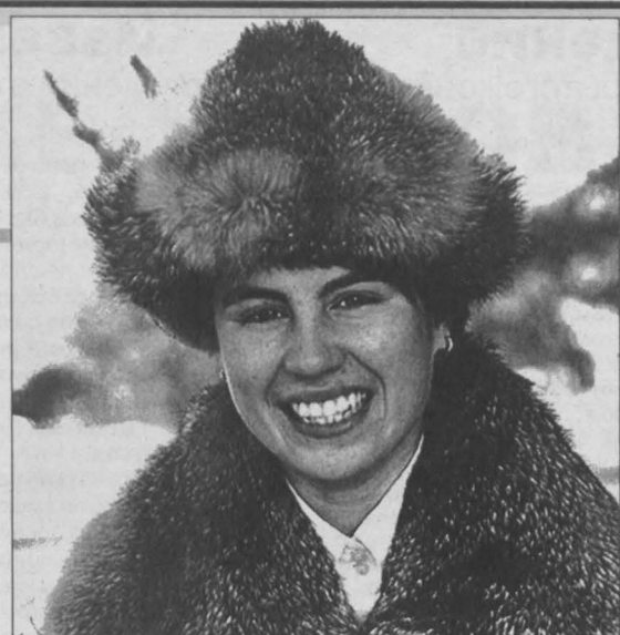
НА СНИМКЕ: лучший результат среди кузбасских сноубордистов — участников зимних Олимпийских игр в Турине — показала 18-летняя Екатерина Тудегешева.

Но будут помнить не только поражения, но и блистательные победы. И сверкающие золотые «бульки» чемпионов Олимпийских игр, счастливые их обладатели, уже внесенные в анналы зимних Олимпиад. Это лыжник Евгений Дементьев и биатлонистка Светлана Ишмуратова, конькобежка Светлана Журова и фигуристы Евгений Плющенко, победительницы лыжной эстафеты Наталья Баранова-Масалкина, Лариса Куркина, Юлия Чепалова, Евгения Медведева-Арбузова, дуэты фигуристы Татьяна Тотьмянина — Максим Маринин, Татьяна Навка — Роман Костомаров, квартал биатлонистки Анна Богалий, Светлана Ишмуратова, Ольга Зайцева, Альбина Ахатова. Они — фигуры знаковые, а значит, и ориентиры на ближайшее четырехлетие.