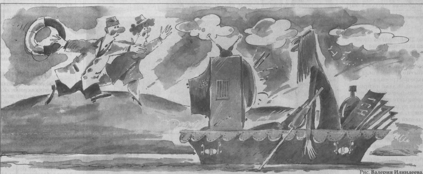
Рис. Валерия Илландева.

Страна, однажды уже поставившая беспрецедентный телеэксперимент с Кашпировским, продолжает наступать на те же грабли. И хотя сеансы массового целительства трансформировались нынче в ток-шоу, суть их не меняется: в процесс сомнительного оздоровления вовлекаются миллионы.