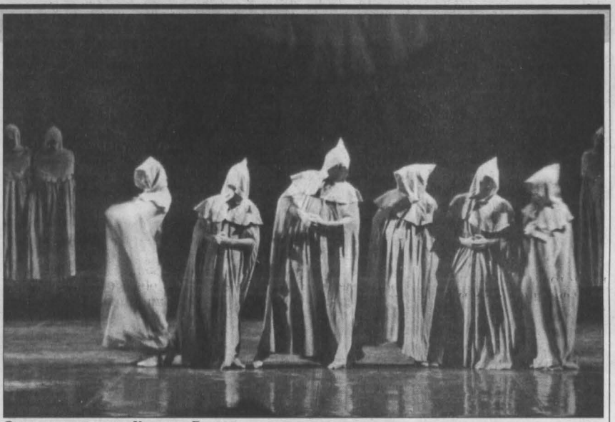
Сцена из спектакля «Кармина Бурана».

Всю минувшую неделю (с 21 по 27 ноября) на сцене Музыкального театра Кузбасса шли спектакли Новосибирского академического театра оперы и балета. «Гастроль, которых ждали 20 лет» — под таким пафосным заголовком наша газета опубликовала анонс этого события. Пафос тогда казался уместным: именно такое настроение предшествовало началу гастрелей. Ждали не просто праздника. Ждали открытия: ведь новосибирский оперный сегодня — один из законодателей мод в мире музыкальных спектаклей. Ждали чудесных встреч: в программе был заявлен концерт, дирижировать которым должен был музыкальный руководитель театра Теодор Курентзис. Дирижер, чей талант его учитель профессор Санкт-Петербургской консерватории Илья Мусин ставит выше таланта других своих учеников — Юрия Темирканова, Валерия Гергиева... И вот гастроль завершена. Если разобраться в сумятице чувств, которыми они сопровождалась, обнаружится, что главное из них — разочарование. Нет, разочаровало нас не искусство соседей-сибиряков! Скорее отношение, с каким это искусство было нам предьявлено.