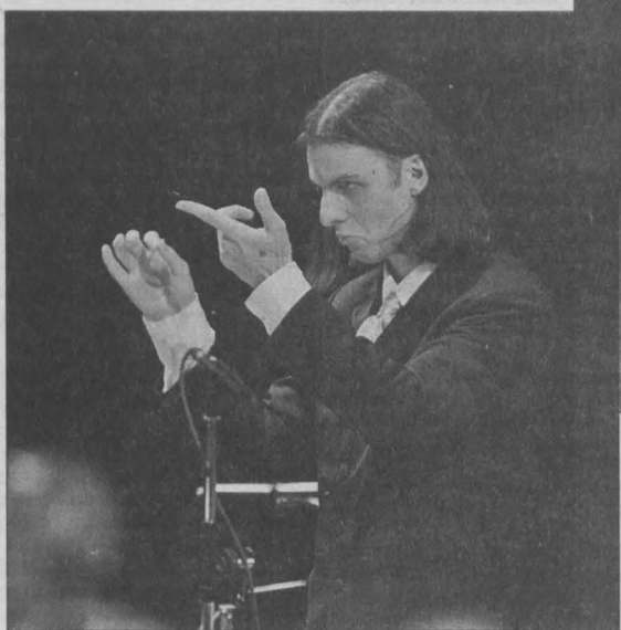
Дирижирует Теодор Курентзис.

А вообще гастролы будут длиться всего неделю — с 21-го по 27 ноября. Все спектакли пройдут на сцене Музыкального театра Кузбасса. Цена би-