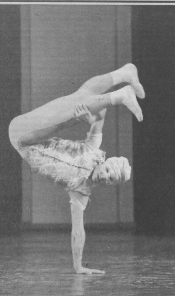
Сцена из спектакля «Пулчичелла».

Разумеется, классику тоже. На открытии гастролей нам представят «Шелкунчик» в постановке петербургского балетмейстера Сергея Викарева: красивую, богатую спецэффектами рождественскую сказку. Надо заметить, это спектакль из тех, которые очень нравятся возрастным ценителям «настоящего искусства» — с бережным про-