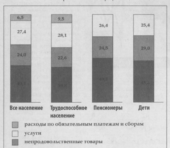
Структура величины прожиточного минимума в III квартале 2006г. (в процентах)

Как видно из диаграммы, почти половина расходов у пенсионеров составляет покупка продуктов питания, а траты на услуги оказываются примерно такими же, как у работающих.