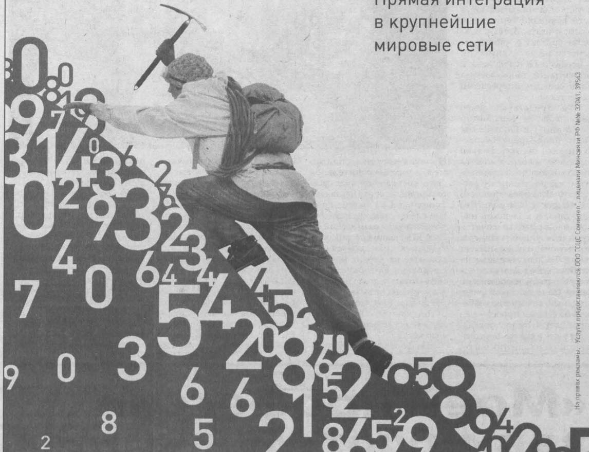
На правах рекламы. Кусты изготавливаются ООО ТДЦ «Сейвент», лицензия Минсвязи РФ № 30341, 39543

Прямая интеграция в крупнейшие мировые сети