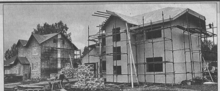
Внесение изменений в некоторые законодательные акты РФ по вопросу оформления в упрощенном порядке прав граждан на отдельные объекты недвижимого имущества» в значительной степени снизила бюрократические преграды в оформлении необходимой застройщику документации. К тому же из городского бюджета выделено 800 тысяч рублей на компенсацию затрат на оформление документов застройщикам из числа граждан, имеющих право на социальные льготы. Сформирована база данных пустующих и брошенных земельных участков, а также сгоревших и брошенных домов на территории города. Ведется работа по установлению владельцев для согласования вопроса либо о застройке брошенного участка, либо освобождении для передачи в аренду другим гражданам.