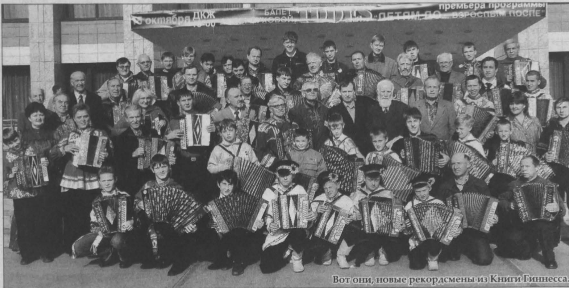
Вот они, новые рекордсмены из Книги Гиннесса.