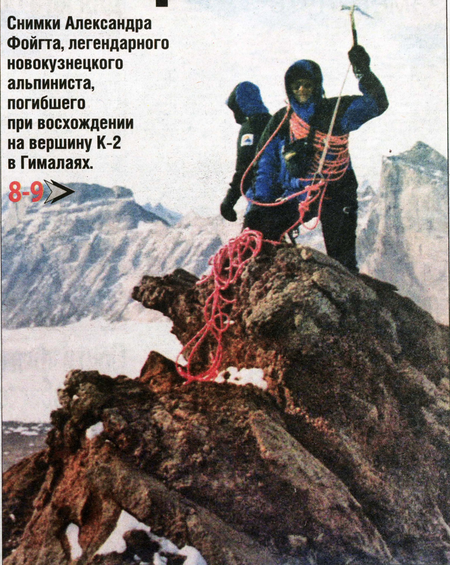
На вершине Г.Жукова в Антарктиде.