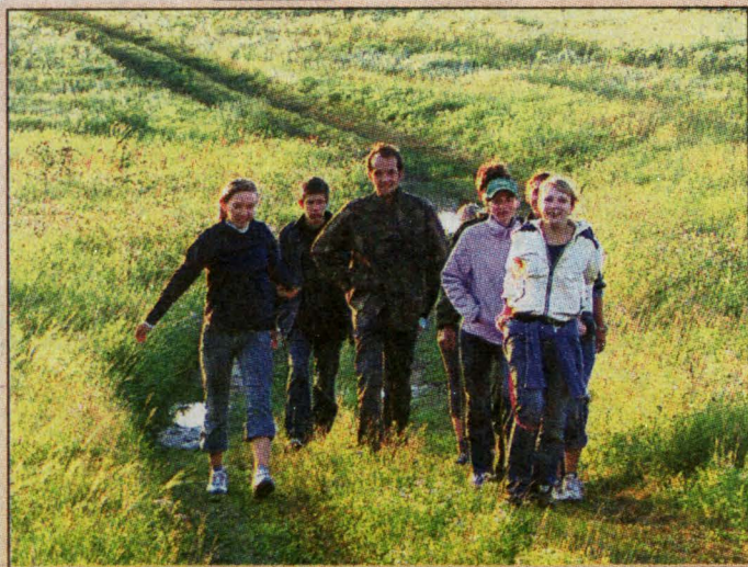
2,5 тысячи лет назад в степях Промышленновского района процветала Тагарская культура.