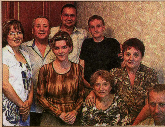
Гости из Чехии в Прокопьевске.