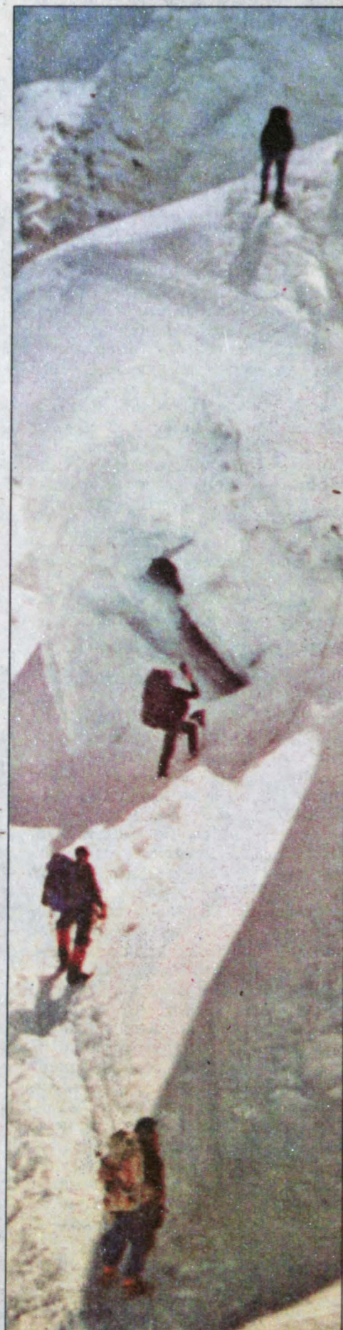
Вверх по ледопаду «Кхумбу».