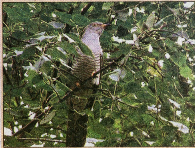
Кукушка многим известна, но немногие ее видели.