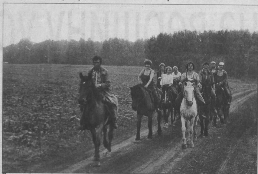
Последний конный маршрут.

Кризис управления — единственная причина закрытия профсоюзных санаториев.