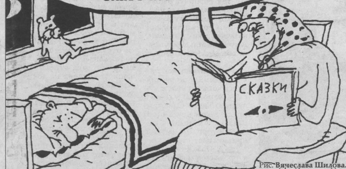
Рис. Вячеслава Шилова.