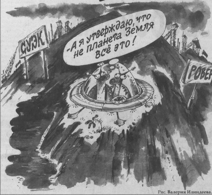
Рис. Валерия Илинцова.

за пользование водой вообще никаких платежей. В общем, присосались к дармовщинке — не отянешь! Шахта 7 Ноября, кроме своих соседей прегрешений, напомнили еще об одном — здесь экономит на средства индивидуальной защиты работников. Может, к Дню шахтера готовят сюрприз — каждому шахтеру подарят по паре новых верхонок? ООО «Ровер» символизирует хорошо известную собаку на сене. Обществом