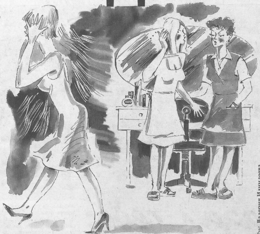
Рис. Валерия Иллариона

решено было затонировать. Нанесли крем-краску, затем стали смывать и... обомлели. Вновь приобретенные волосы буквально на глазах свернулись, словно молоко, попавшее в стакан с лимонным соком. С таким трудом наращенные пряди вдруг моментально стали скатываться в плотный комок, так называемый «колтун». Который можно было снять с головы лишь двумя способами: либо расчесать, применив невероятные усилия, либо остричь многогрядную Светлану голову налысо. Бриться под Котовского Светлана категорически отказалась.