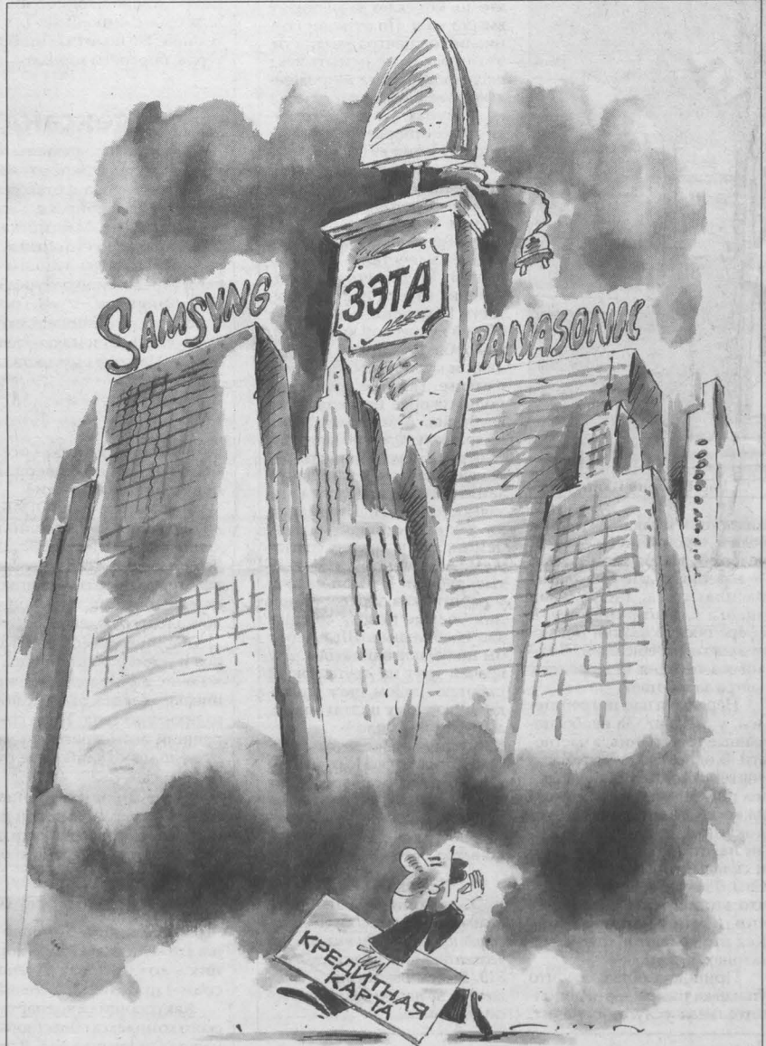
Рис. Валерия Илиндеева.

узнав, что доля кредитов в активах «вашего» банка составила 73 процента, а доля просроченной задолженности превысила 20 процентов. Итак, нашей банковской системе грозит кризис? По словам представителя филиала крупного московского банка, работающего в Кузбассе, данные о задолженности преувеличены. Мол, просроченные кредиты возникают лишь в банках, созданных для розничного кредитования. Это они ведут агрессивную