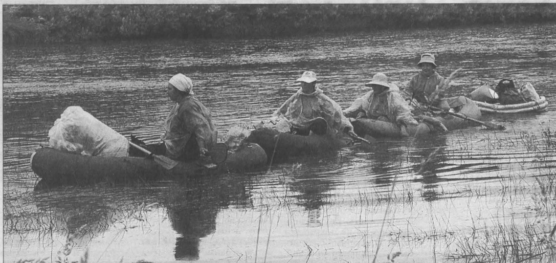
«Флотилия» на реке Кондоме.

У современных бабушек-путешественниц и современной мобильная связь. Благодаря ей родня участниц экспедиции в курсе всех