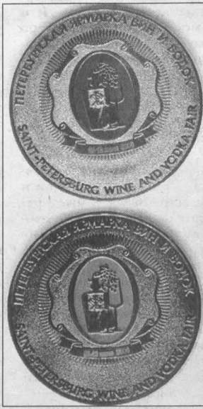
— и те, кто уже хорошо знает продукцию Мариинского ликероводочного завода и даже бывал у нас в гостях, и те, кто проявил к ней интерес впервые. После поездки в Турцию весной этого года, где мы получили три золотые и три се-

Светлана ЕРШОВА. НА СНИМКАХ: «Гран-при» выставки; серебряная и золотая медали.