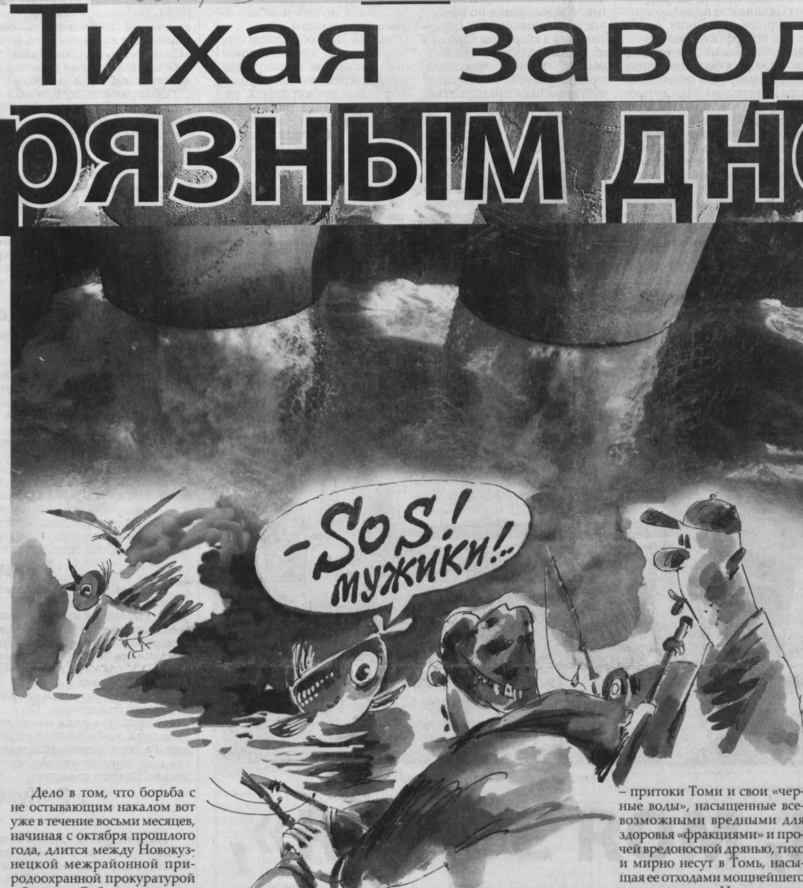
Рис. Валерия Илиндеева.