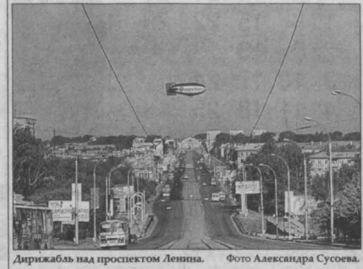
Дирижабль над проспектом Ленина.