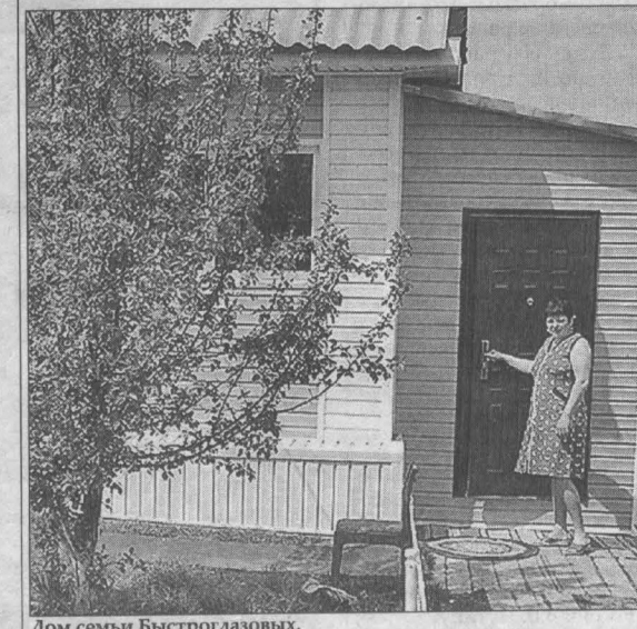
Дом семьи Быстроглазовых.

Дина КАЛИТИНА. Фотот автор. Проклеповский район.