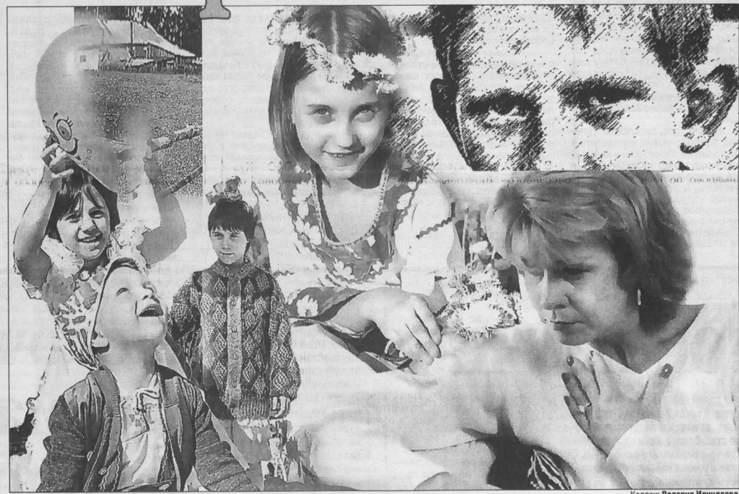
Коллаж Валерия Илландова.

Тележурналист сменила профессию: стала хозяйкой большой приемной семьи.