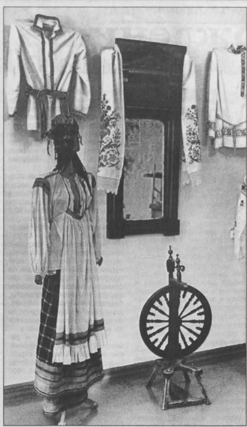
придавалось большое значение. Находиться без него в обществе считалось крайне неприлично. Распоясать человека — значит его обезопасить, так считалось у наших предков. Таковы простые и суровые нравы времен столетней и более давности, бывавшие в кузнецкой, да и не только, стороне.

И еще одна существенная деталь старинного гардероба. Мужскую и женскую одежду обязательно дополняли пояса, скатки, также представленные на выставке. В быту и обрядах поясу