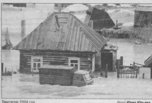
Таштагол, 2004 год.

Весеннее половодье, когда водоемы становятся опасными, происходит в Кузбассе практически каждый год. Тревожным остается прогноз и в этом году. Снега много, и скоро он начнет таять, заливая все, что попадет ему на пути. И каждый год на этом пути попадают населенные пункты, построенные, увы, без учета гидрометеорологических особенностей местности. Ущерб, который принес кузбассовцам в прошлом году весенний паводок, весьма ощутим — 750 млн. рублей. Общая сумма убытков, заявленных гражданами в страховые компании области, составила 23 миллиона 411 тысяч 845 рублей. Возмещение получили 4050 человек. Это те, кто заранее побеспокоился о возможных последствиях, связанных с приходом ежегодной стихии.