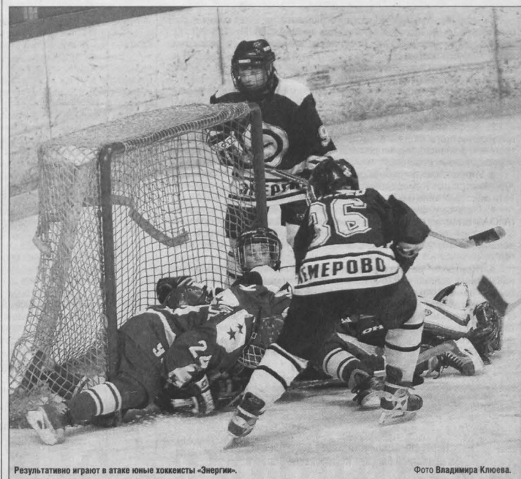
Результативно играют в атаке юные хоккеисты «Энергия».

хоккей: первенство Сибири и Дальнего Востока