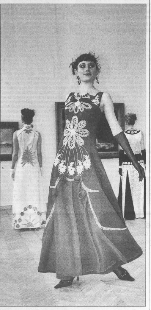
Ольга ШТРАУС.

Борис ПРОСКУРИН. НА СНИМКАХ: Константин Павлов из Ленинска-Кузнецкого в очередной раз стал сильнейшим.