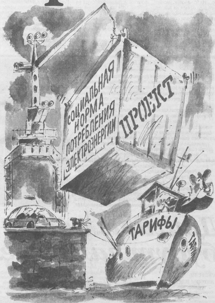
Рис. Валерия Илиндева.