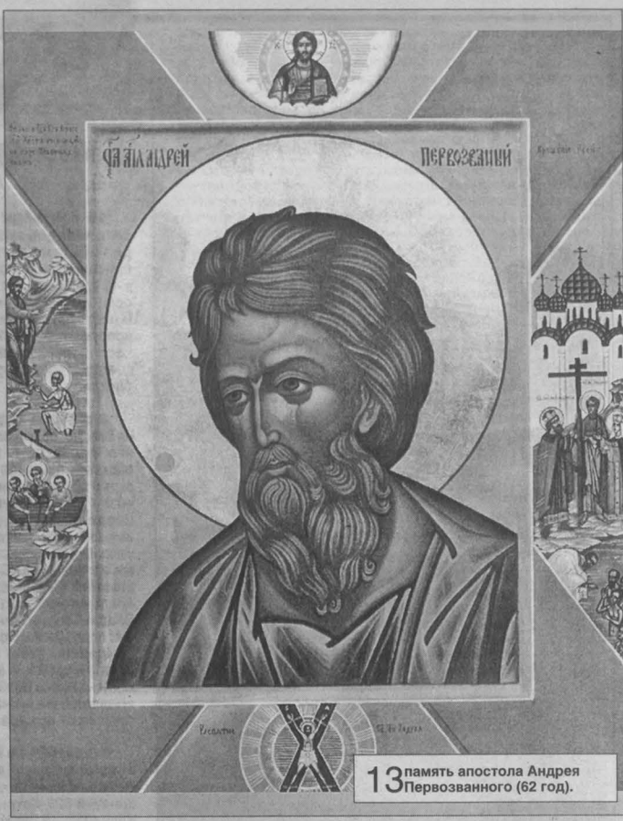
13 память апостола Андрея Первозванного (62 год).