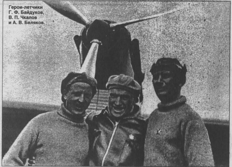
Герои-летчики Г. Ф. Байдуков, В. П. Чкалов и А. В. Беляков.

● 28 декабря в Новосибирске открылся Государственный цирк Звонцера, первый цирк могли лицезреть только диковники обитатели мировой фауны, дикие обезьяны, удавы, львиные крокодилы, страусы.