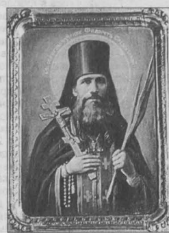
Преподобномученик Филарет Срезневский (Пряхина)

Преподобномученик Филарет (в миру Иван Трофимович Пряхин) родился 9 августа 1884 г. в селе Чулково Пронского уезда Рязанской губернии в благочестивой крестьянской семье. 21 апреля 1913 года пострижен в монашество с именем Филарет в честь святителя Филарета Милостивого, 18 августа 1913 года рукоположен в иеродиакона, 16 ноября 1914 года – в иеромонаха, в 1926 году в Москве, архиепископом Тверским Серафимом (Александровым) отец Филарет был возведен в сан игумена.