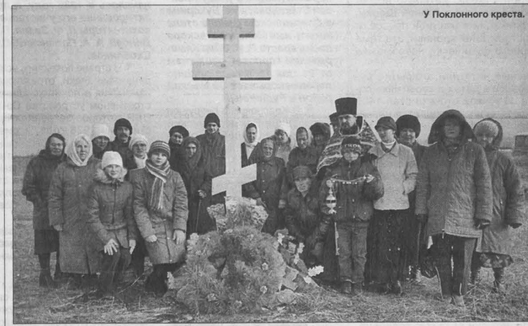
У Поклонного креста.

По отшествии батюшки в мир Горний помощь его постоянно ощущается людьми, которые в молитвах обращаются к нему, чему имеется множество свидетельств.