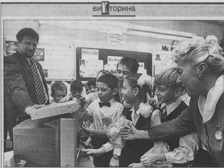
Ученики 3 «А» класса МУО «Лицей № 23» г. Кемерово.