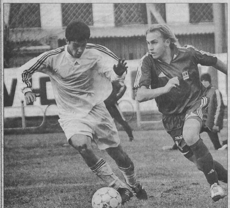
футбол: турнир «Надежда»