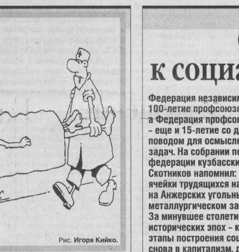
Рис. Игоря Кийко.

У кабинетов к участковым терапевтам - постоянные очереди. К своему участковому врачу люди записываются за неделю вперед. А как же попасть на прием, если заболел внезапно? Давление поднялось или простуда скрутила?