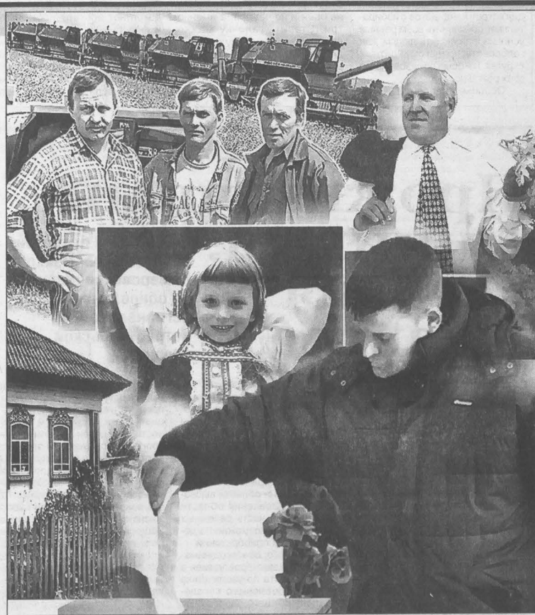
Коллаж Валерия Илландова.

Время политиков-одиночек прошло. Те перемены, которые произошли в Кузбассе с 1997 года, стали возможными именно потому, что я опирался и опираюсь на коллектив соратников. В нашей области создана одна из самых значительных в стране программа социальной защиты населения. Всё потому, что и законодательная, и исполнительная власть в равной мере озбочены интересами людей.