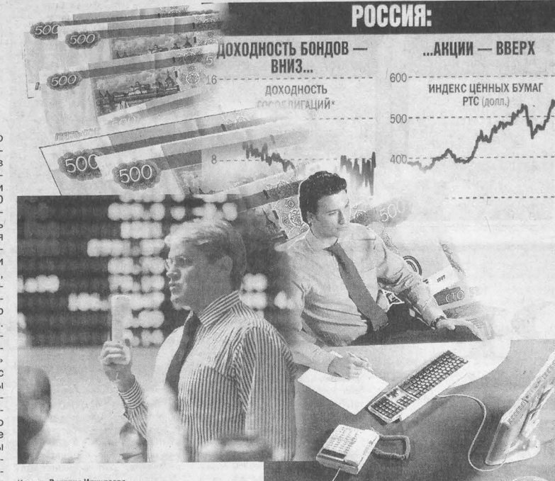
Коллаж Валерия Илиндева.

Для тех же, кто привык рисковать и хотел бы получить больший доход от работающих денег, существуют всевозможные инвестиционные фонды,