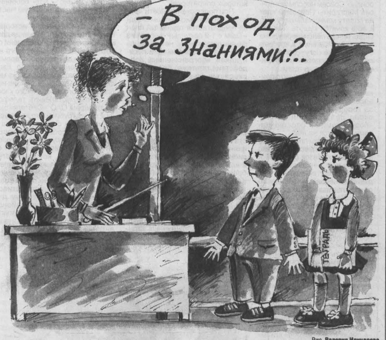
Рис. Валерия Иллешева.