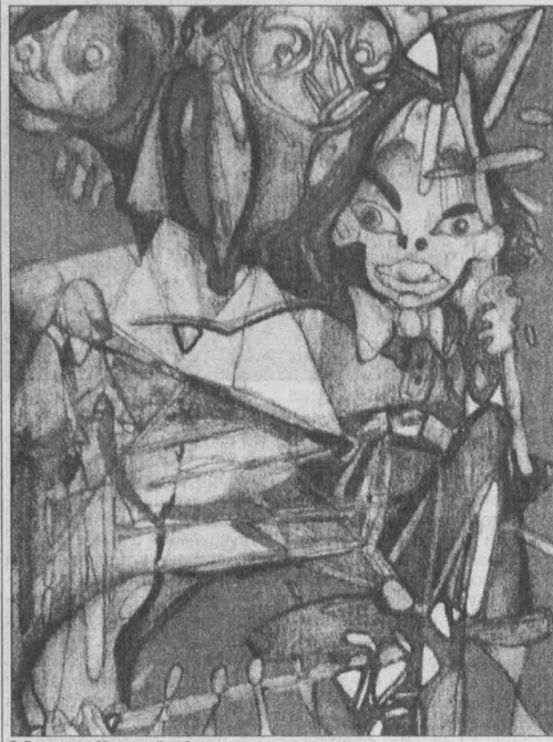
В. Герасимов «Маленький рыбак».