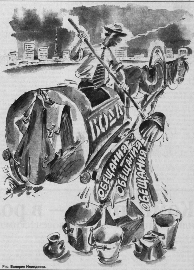
Рис. Валерия Илиндева.

— Сидим без воды, а платит приходится по полной — 30 рублей в месяц с человека берут.