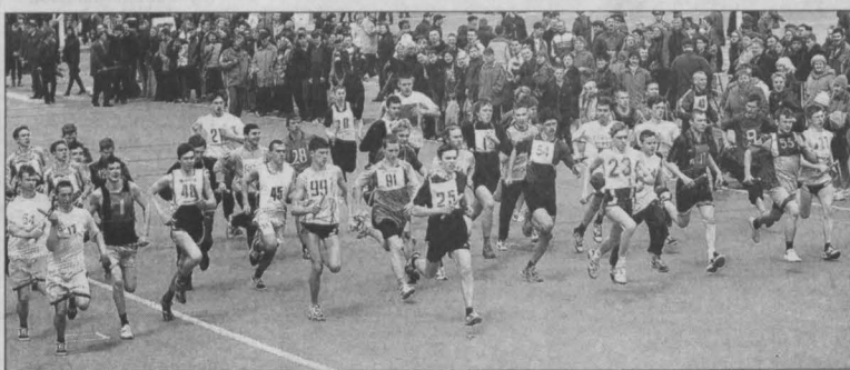
на призы газеты «Кузбасс»