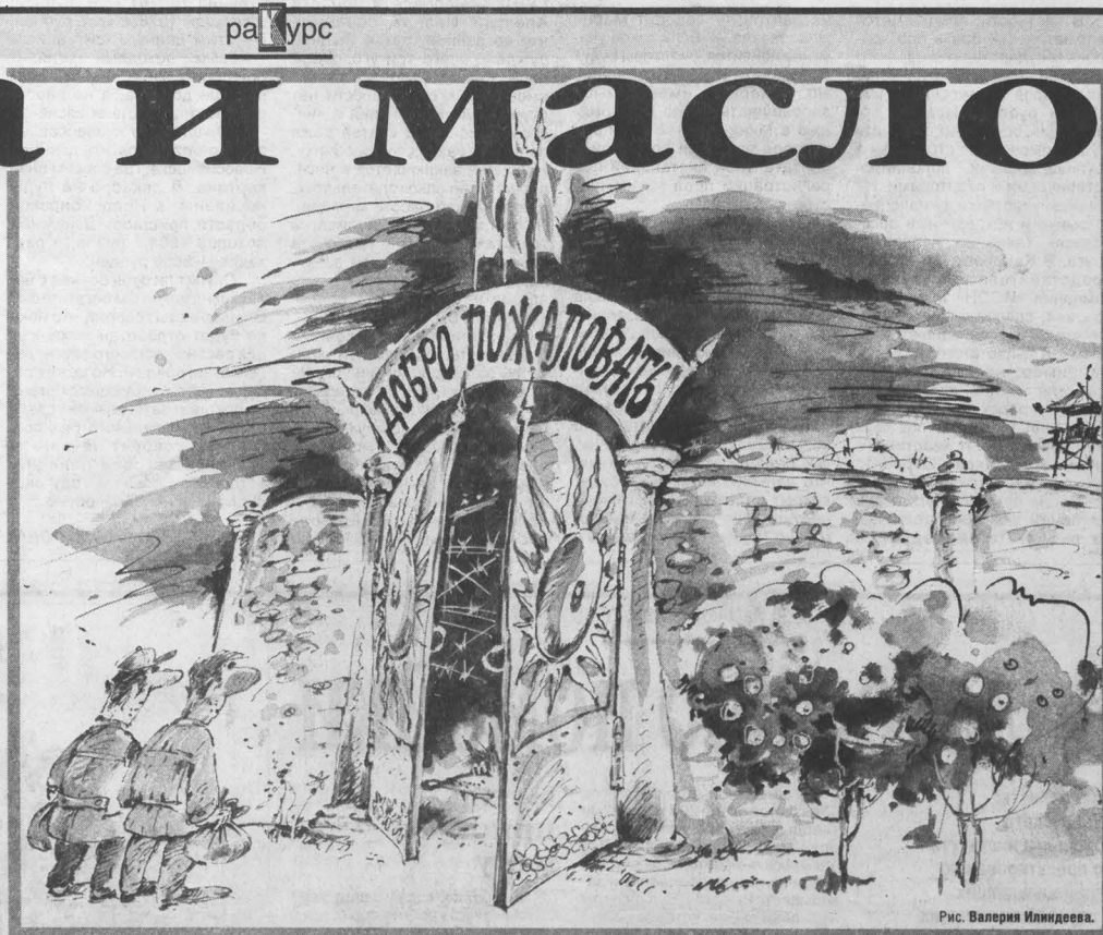
Рис. Валерия Илларионова

Немного предосторожности. Районный центр Яшкино с населением 16 тысяч человек имеет статус рабочего поселка. Последний раз я тут был около трех лет назад, и тогда поселок уместнее было называть безработным — практически все трудоспособное население (а это шесть тысяч человек) хоть раз в год обращалось в местную службу занятости в поисках работы, которая массовым образом кончилась вместе с официальным градообразую-