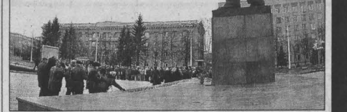
Вчера в России отметили 134-ю годовщину со дня рождения Владимира Ильича Ленина. В этот день те, кто хотел почтить память вождя мирового пролетариата, несли цветы к его памятникам. Сложившейся традицией следовали и в Кузбассе. Вчера члены Кемеровского городского совета ветеранов возложили цветы к монументу Ленина, расположенному на главной площади области.

Шведы представляют широкий спектр сфер деятельности: от разработки профилактических мероприятий, в течение месяца пройдут лекции, консультации специалистов, конференции, «круглые столы», семинары, спортивные мероприятия, будет распространяться различная литература.