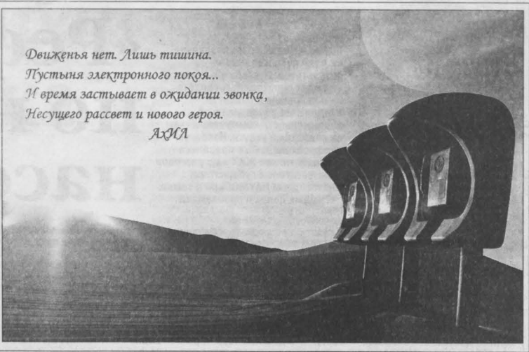
«Виденья нет. Лишь тишина. Пустыня электронного покая... И время застывает в ожидании звонка, Несущего рассвет и нового героя.» А.Ж.А.

В последнее время цифровое искусство — «digital» (отсюда и название, выставки) — очень популярно. Из первоначальной промышленной функции (создание образа машин, архитектурных проектов) цифровая фотография выделась в самостоятельный вид творчества. Многие специалисты, правда, считают, что виртуальные композиции, созданные с помощью компьютера, нельзя назвать фотографией в полном смысле этого слова. Но сами ребята считают, что компьютерная графика, живопись — это новый вид творчества. Это современное искусство, которое заслуживает внимания. И как знать, может, когда-нибудь оно станет приметой нашего времени... Понравившиеся работы можно купить и таким образом придать индивидуальность своему жилищу или офису. Приобщиться к современному и оригинальному творчеству можно по адресу: ул. Тухачевского, 12, «Библиотека на Тухачевского». Выставка продлится до 7 апреля. Ольга ЗОЛОТУХА. НА СНИМКЕ: композиция Ильдара Ахметгалеева «Пустыня разума».