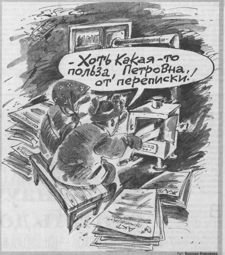
Рис. Валерия Ильинцева.

заключенные колонии наверняка замерзнут без нашего угля. В эпистолярном жанре В Мариинской администрации заложенному дому посвящен целый том документов. Эта переписка началась в прошлом году. «...С начала отопительного сезона идут постоянные срывы температурного графика. Руководство колонии оправдывает недостатки по работе котельной отсутствием или плохим качеством поставленного угля.