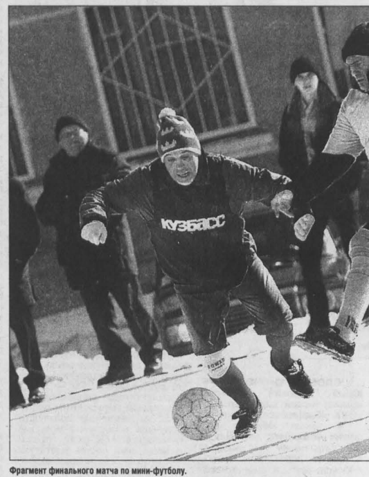
Фрагмент финального матча по мини-футболу.