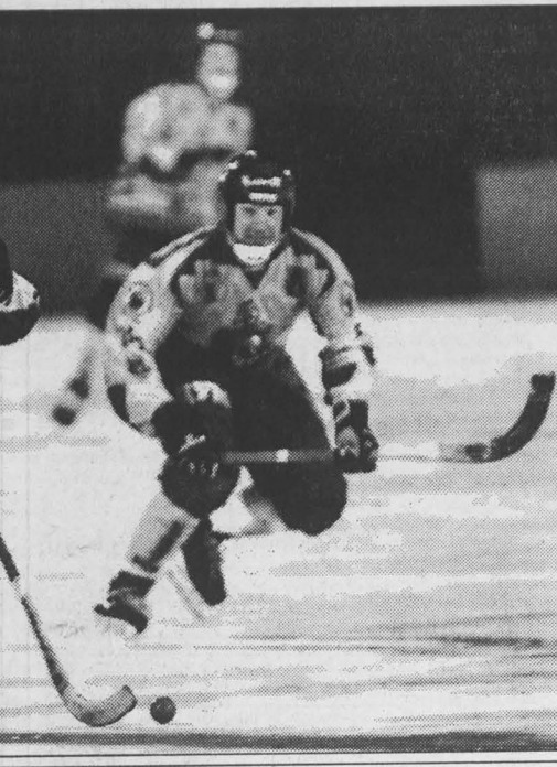
Иркутяне в ожидании гола

Десять тысяч иркутян стали свидетелями нулевой ничьей местного «Байкала-Энергия» с лидером восточной группы — кемеровским «Кузбассом».