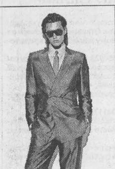
Этот стиль предполагает минимум ароматов. Обувь на каблуке, гладкий носок. Строго оформленные часы с белым циферблатом, на каждом ремешке или металлическом браслете. Стрижка мужчины раз в две недели, поэтому ощущение так, что волосы почти не растут и всегда в идеальном состоянии.

На втором месте по воздействию галстуки с крупным, геометрическим узором. Мужчине с плавной линией подбородка надо стремиться к менее выраженной геометрии. Те, у кого подбородок явным треугольником, квадратом, в геометрии смотрятся выигрышно, красиво. На третьем месте идет однотонный галстук, на четвертом — полоски, потом — «отурцы» и растительный орнамент и последнее место занимает клетка. Галстук подбирается в тон пиджаку или рубашке. Его ширина пропорциональна ширине лацкана. Важно не только правильно подобрать, но и завязать галстук. Самый лучший материал для галстука, как известно, натуральный шелк и шерсть. В зависимости от выбранного стиля мужчина надевает на вечеринку галстук, бабочку, которая бывает и фиолетового, зеленого, бордового цвета, или шейный платок. Носки. А вот тут будем категоричны: не белые и не яркие. Однотонные, в цвет обуви или брюк.