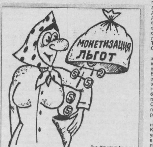
Рис. Ильяма Азимова.