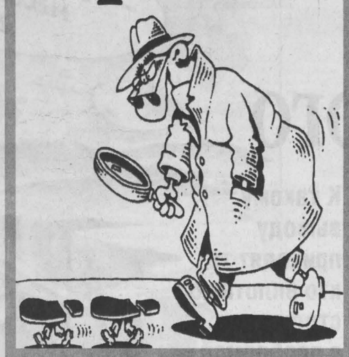
Рис. Игоря Кайко.

демократического общества. 90 процентов дел там рассматриваются судом присяжных, но там нет такого вала оправдательных вердиктов, потому что намного выше уровень общественного правосознания. В этой стране права личности неприкосновенны. Если человек оскорбил на улице или залез в его машину, это уже считается серьезным преступлением, за которое нарушивший будет нести ответственность перед обществом. А у нас получается иначе: убить троих человек, а преступника, чья вина доказана следствием, оправдать. Это уровень правовой сознательности населения, его отношения к совершившимся фактам и работе правоохранительных органов.