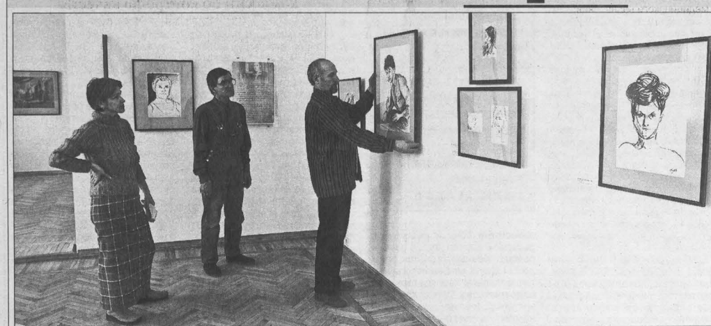
Перед открытием выставки.