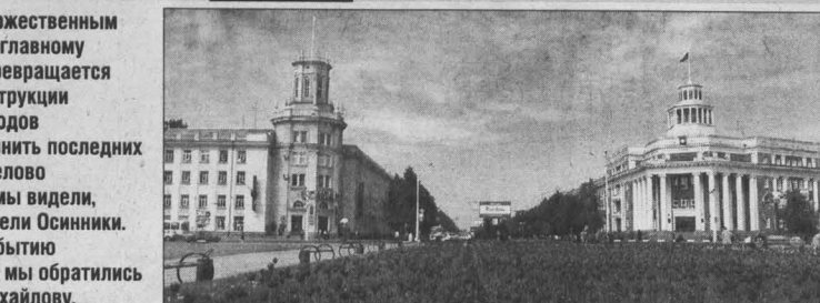
Традиционно подготовка к торжественным мероприятиям, посвященным главному всекузбасскому празднику, превращается в большую программу реконструкции и обновления шахтерских городов и поселков.