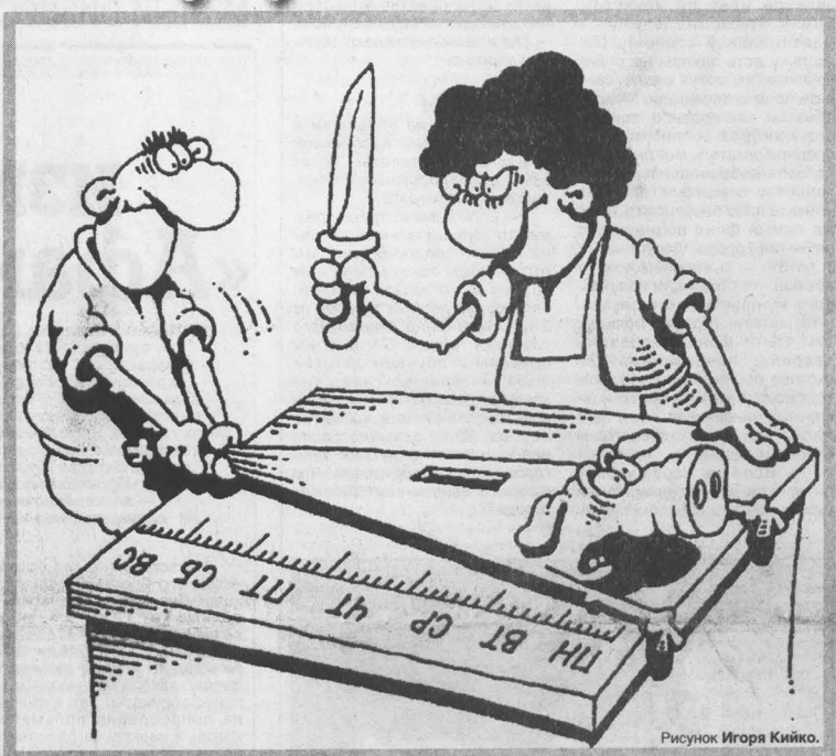
Рисунок Игоря Кийко.

Положим даже, что подобное предложение рассмотрено и принято Госдумой. В самом деле, кто ж будет спорить с тем, что зарплата педагогов