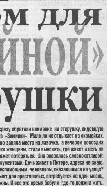
Коллаж Валерия Ишидеева.