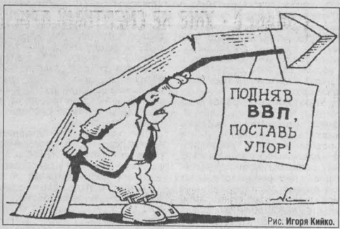
Рис. Игоря Кийко.