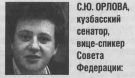
С.Ю. ОРЛОВА, кузбасский сенатор, вице-спикер Совета Федерации:

Принятый 5 августа в третьем и окончательном чтении законопроект о льготных выплатах 8 августа был рассмотрен и в Совете Федерации.