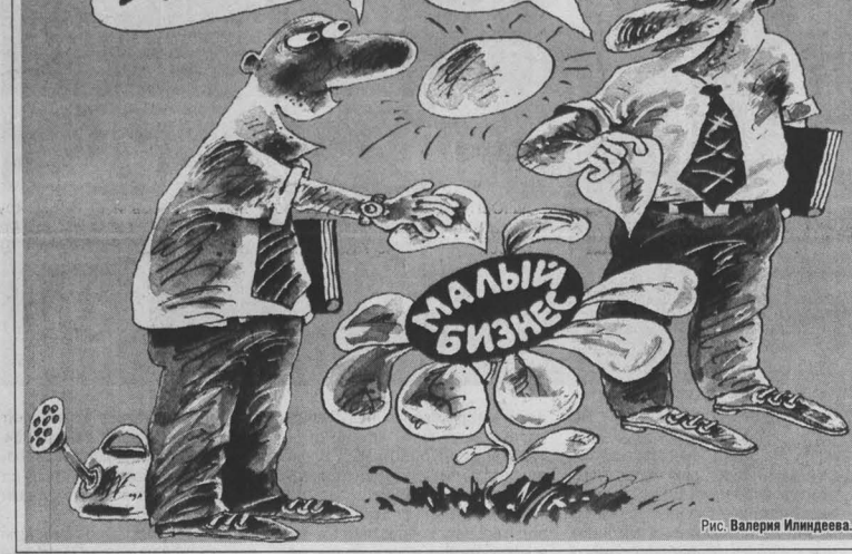
Рис. Валерия Илландова.

P.S. «Отмена данного закона недопустима. Это разрушит созданную в регионах России систему господдержки малого предпринимательства, затормозит дальнейшее развитие этого важного сектора экономики», — это мнение Российской торговой-промышленной палаты, первой залившей тревогу по поводу угрозы, нависшей над 88-ФЗ. Его поддержали участники экстренного заседания общественно — экспертного совета по малому предпринимательству Кемеровской области. Их позиция совпадает: «Вопрос об отмене закона целесообразно рассматривать только с одновременным принятием нового федерального закона по вопросам развития малого предпринимательства». Общественно-экспертный совет направил обращение с просьбой прислушаться к этому мнению Президенту России, председателям правительства, Госдумы и Совета Федерации, а также депутатам Госдумы от Кузбасса.