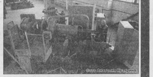
Вчера в Мысках на Томусинском заводе железобетонных конструкций ОАО «Южный Кузбасс» состоялось открытие нового производства...