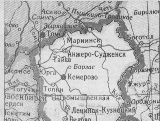
Помощь придет с северо-востока!

Воспользуемся ли возможностями, которые предоставляет нам проект, или нет, не будем решать. Мы лишь хотим сказать, что если этот проект не осуществится, то Арал к 2010 году исчезнет полностью.