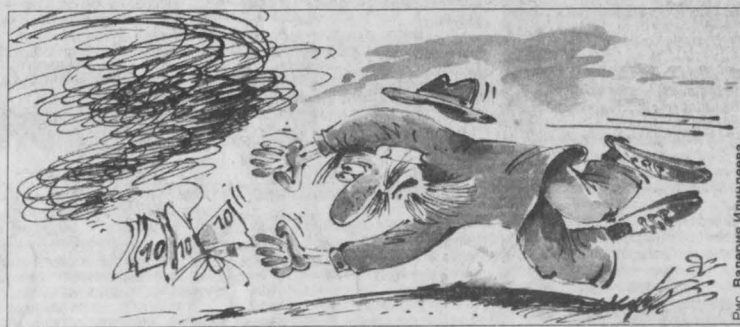
Рис. Валерия Ильинцева.

Трудно даже представить, каким методом пользуются работники пенсионной службы, чтобы растолковать какой-нибудь любопытствующей старушке, почему к её пенсии после очередного перерасчета прибавили именно 15 рублей 82 копейки, а не 17 руб. 34 коп., как ее соседке или кому?