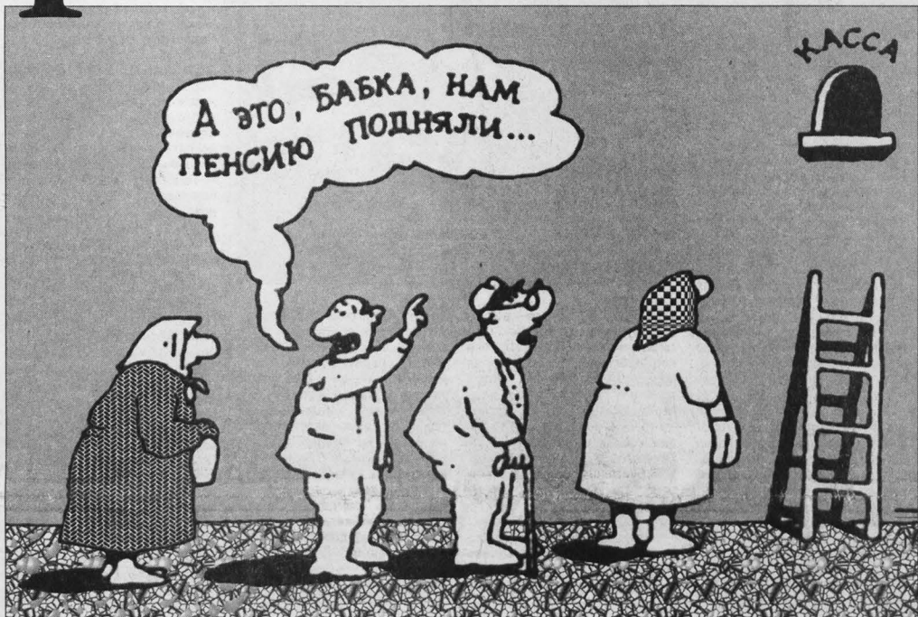
Рисунок Игоря КИЙКО.

Госдума приняла закон о перерасчете пенсий. Это уже вторая редакция законопроекта, первая ранее была отклонена Советом Федерации. Предметом споров законотворцев стал вопрос об учете «нестраховых» и льготных периодов при расчете пенсий. Кажется, на этот раз думцы согласовали этот момент с Советом Федерации, и оснований для отклонения принятого закона будто бы нет.