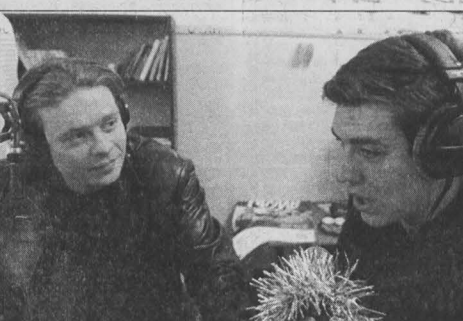
Звезды сериала на «Радио Кузбасса».

Популярные актеры Павел Майков и Дмитрий Дюжев — они же Печел и Космос из нашумевшего сериала «Бригада» — стали вчера гостями кемеровчан.