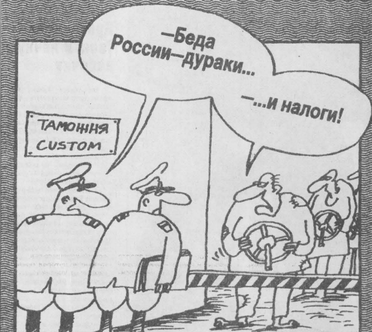
Рис. Вячеслава Шилова.

Юрга недоверчиво, осторожно переводит дух. За долгие годы кризиса впервые обозначились оптимистичные перспективы. Город-завод — так его называли, оценивая градообразующую роль Юрмаша, одного из крупнейших оборонных предприятий СССР. За несколько лет конверсии завод потерял — тысячи рабочих мест, налогооблагаемую базу, устойчивое финансирование социальной сферы. Сегодня Юрга напоминает враз оживающего человека, который помнит о лучших временах, но прожить без подаяния не способен. 26 февраля на сессии городского совета был принят бюджет на 2003 год. На две трети он состоит из дотаций. Город не в состоянии содержать себя. Здесь один из самых низких прожиточных минимумов в регионе (1930 рублей), а заработная плата на большинстве предприятий и того меньше, что отбрасывает тысячи юргинцев за черту бедности. Пенсионеры составляют почти 27 процентов населения. По существу, бюджет в последние годы идет на зарплату бюджетников и социальную поддержку горожан, помогаю им выжить в крайне сложных обстоятельствах. Однако в январе 2003 года, впервые за последние десятилетия, Юрмаш погасил все долги по заработной плате машино-