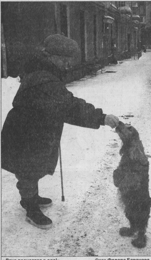
«Друг познается в еде!».