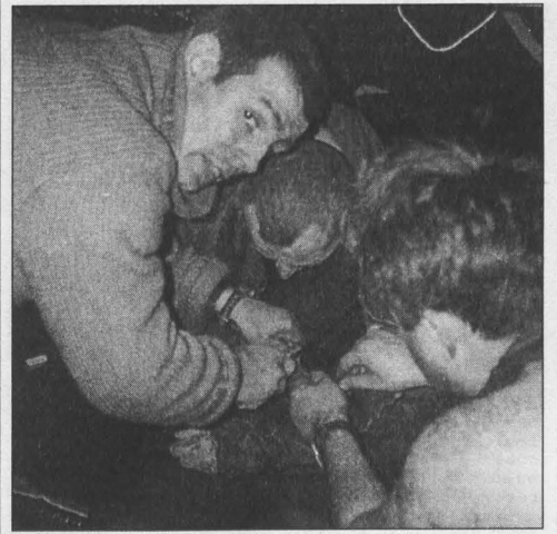
Кузбасский СОБР в Чечне, первая помощь раненому.