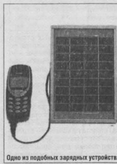
Одно из подобных зарядных устройств.

Опытный образец этого устройства — Solar Mobile Phone Charger — был представлен на выставке Environment and Energy Exhibition. Изобретатели рассказали, что для зарядки достаточно разложить портативный блок из трёх солнечных батарей и подключить к нему телефон. Устройство появится на рынке в следующем году, а первыми пользователями станут жители арабских и африканских стран. «В этих странах всегда солнечно, при этом там очень много владельцев мобильных телефонов», — объяснил менеджер компании Лекор. — Мы одни из первых, кто выходит на рынок с таким изобретением, и полагаем, что нас ждёт большой успех». Ну и как вам это изобретение? Действительно необходимо? Об этом мы спросили операторов сотовой связи. В отделе маркетинга компании «Сотел» уверены в нужности такого устройства: — Конечно, ведь использовать солнечную энергию очень удобно. Допустим, вы оказались