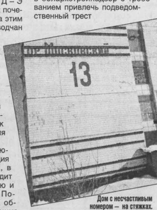
Дом с несчастливой судьбой — на стяжке.

«Кемеровогражданстрой» к ответственности за допущенные многочисленные отступления от проекта. Однако, несмотря на столь очевидные нарушения, строители не понесли никакого наказания. «Дело» потонуло в начавшихся разбирательствах уже на уровне областного строительного совета. Специалисты выдвинули по одному, но другие версии разрушений. Мол, могли быть и ошибки проектировщиков, и нарушения технологии заводом («Стройиндустрия», приведшие к утолщению стеновых конструкций, запроектированных как са-