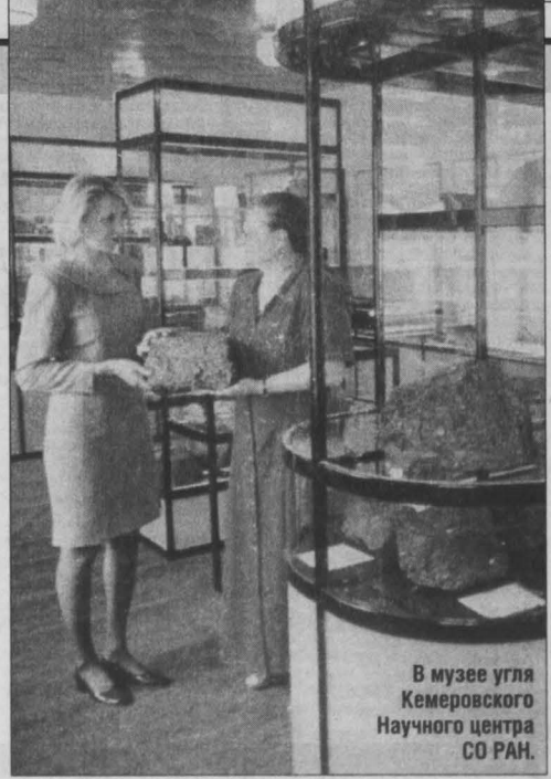
В музее угля Кемеровского Научного центра СО РАН.

Особая благодарность за то, что они помогают решать конкретные социально-экономические проблемы региона. Прежде всего, работают по заказам наших базовых отраслей — угольной, химической и металлургической, занимаются обеспечением безопасности труда на шахтах и разрезах, созданием строительных материалов, вопросами энергоснабжения, разрабатывают современные медицинские технологии и продукты питания.